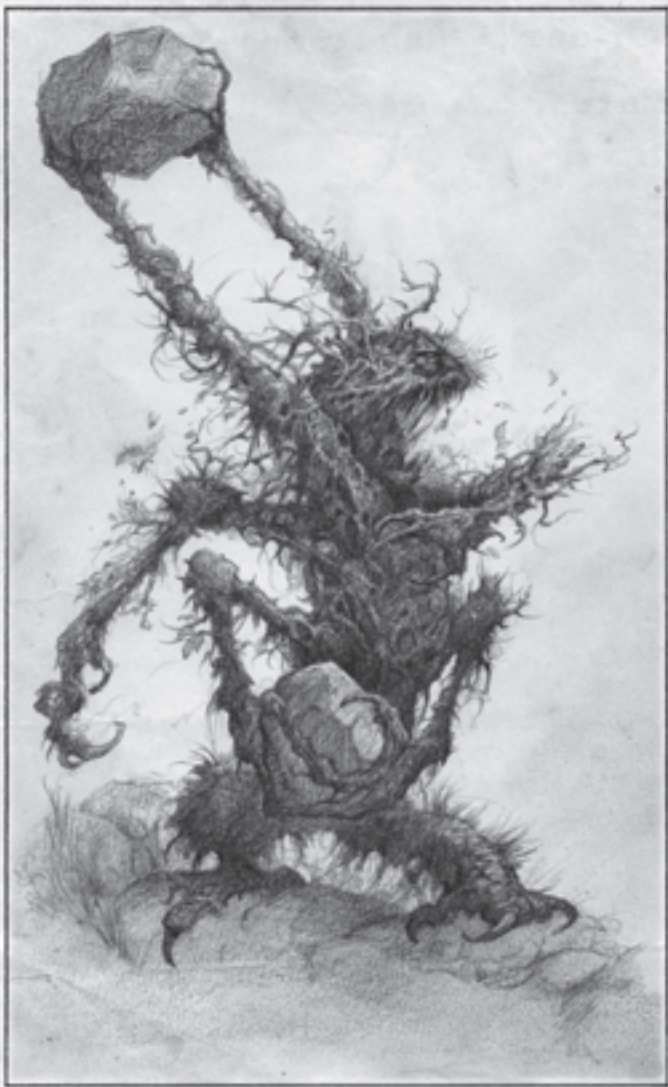
Öfkeli bir kaya-fırlatıcı