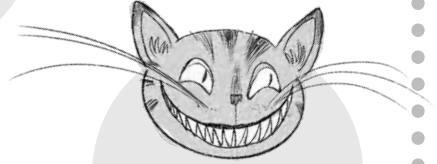
Çeşir Kedisi (Cheshire Kedisi)