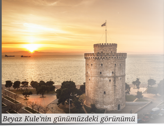
Beyaz Kule'nin günümüzdeki görünümü

Günümüzde Yunanistan'ın sınırları içinde kalan, Mustafa Kemal'in doğup büyüdüğü Selânik; Makedonya'nın kültürel, ekonomik, siyasi ve sosyal açıdan en gelişmiş şehriydi. Yandaki görsele verilen ve Osmanlı Devleti zamanında Kanuni Sultan Süleyman tarafından yaptırılan "Beyaz Kule", ticari hayatın merkezi konumunda olan Selânik Limanı'nı simgeleyen en önemli yapıydı. Çoğunlukla Türk nüfusuna sahip Selânik'te Yunan, Ermeni, Bulgar, Yahudi gibi çeşitli din ve etnik kökenden insanlar bir arada bulunmaktaydı.