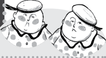
Eciş ile Bücüş