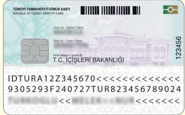
Türkiye Cumhuriyeti Kimlik Kartı

Türkiye Cumhuriyeti Kimlik Kartı'nın sağlayacağı kazanımlar şunlardır: