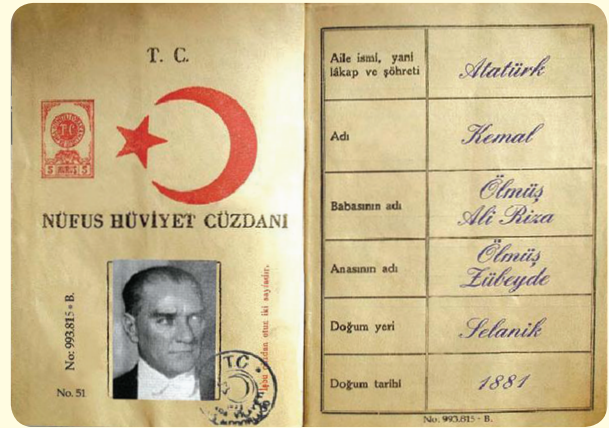
Nüfus Hüviyet Cüzdanı