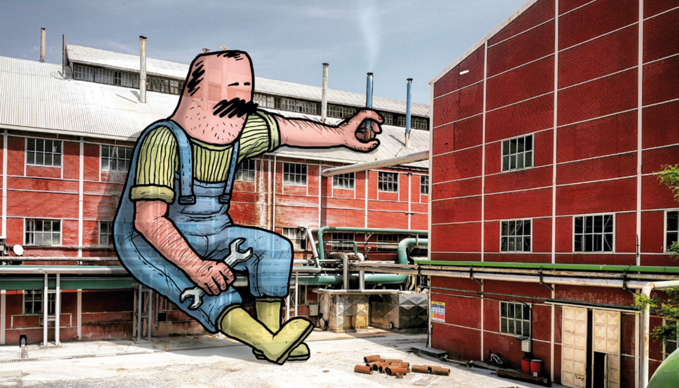
3-Fabrika / Eskişehir