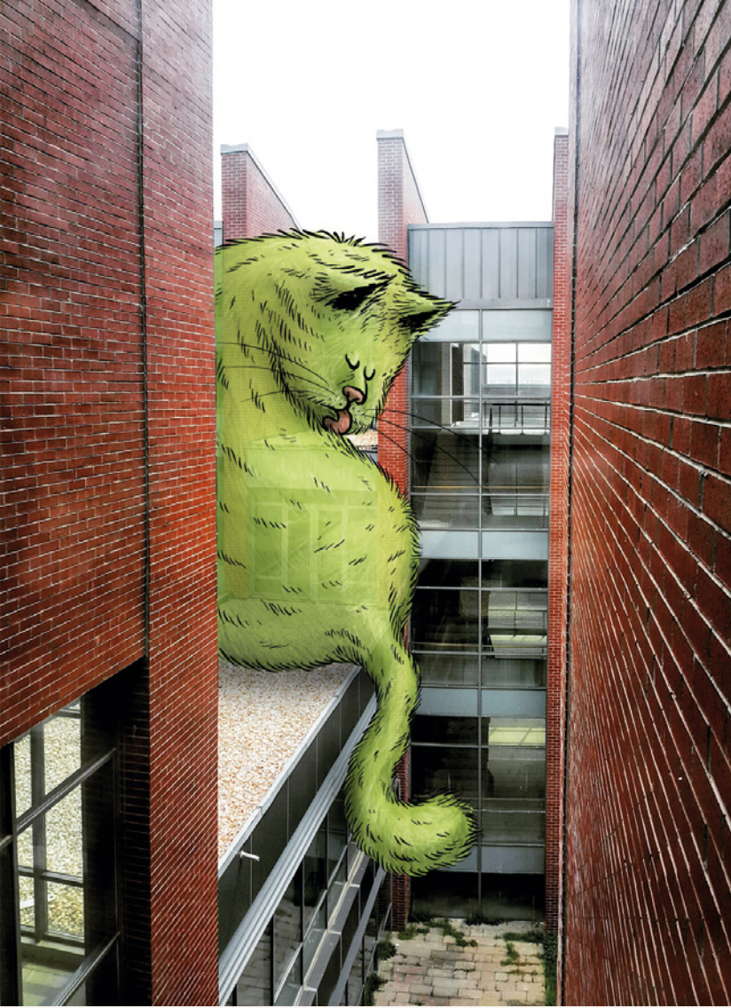
7-Temizlik / Eskişehir