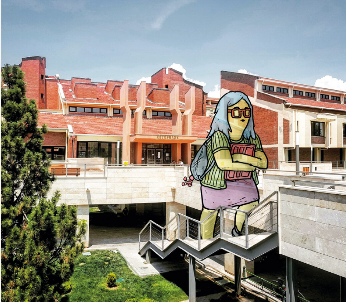
1-Kampüs / Eskişehir