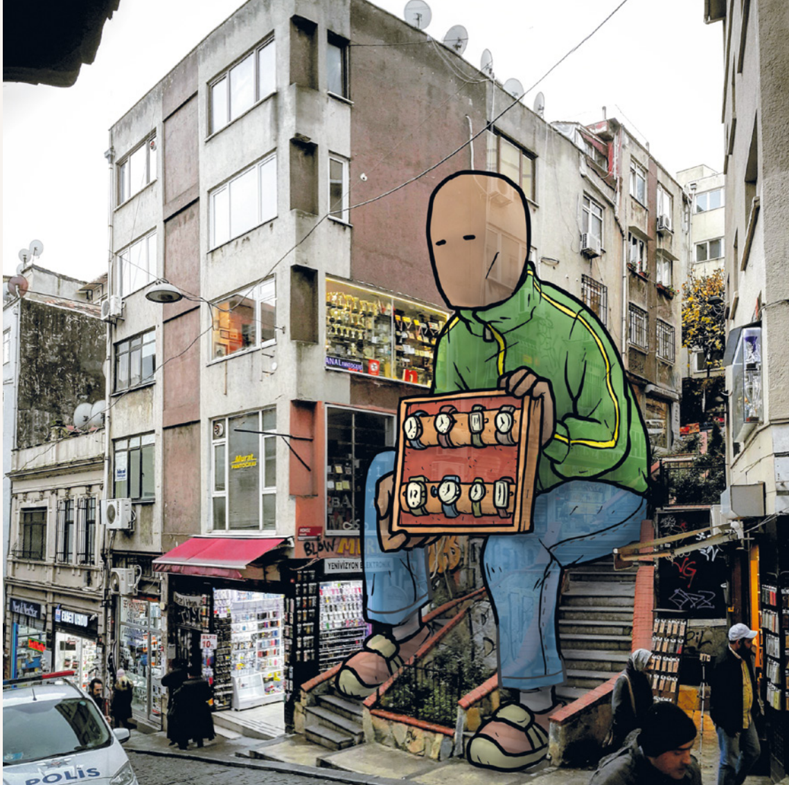
9-Saatçi / İstanbul