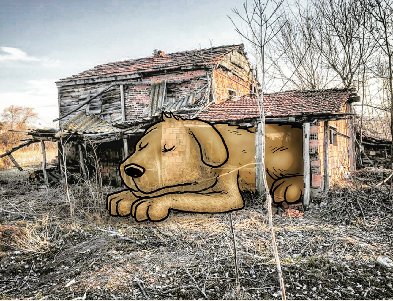
8-Kestirme / Eskişehir