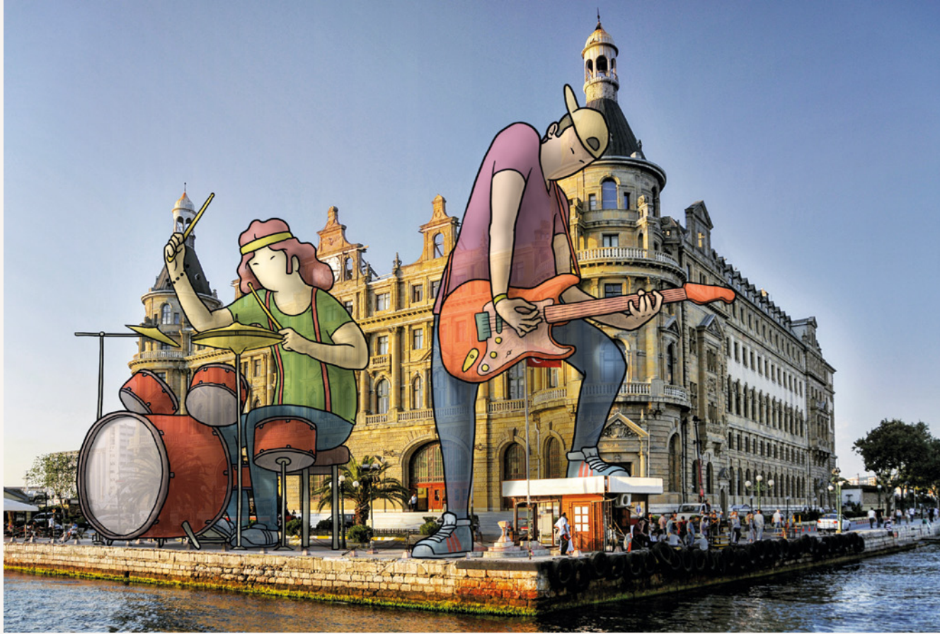
6-Band / İstanbul