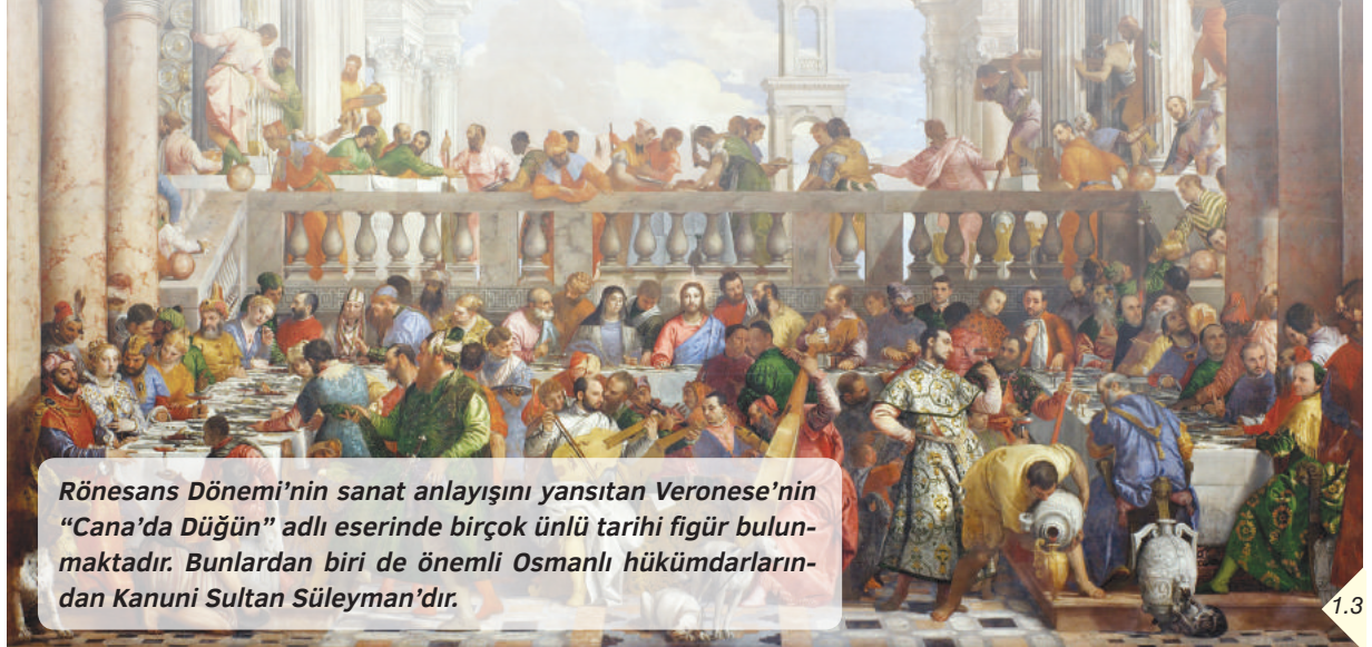
Rönesans Dönemi'nin sanat anlayışını yansıtan Veronese'nin “Cana'da Düğün” adlı eserinde birçok ünlü tarihi figür bulunmaktadır. Bunlardan biri de önemli Osmanlı hükümdarlarından Kanuni Sultan Süleyman'dır.

Tüm bu gelişmeler Avrupalıların dünyaya ve evrene yönelik görüşlerinin değişmesinde etkili olmuş, böylece Avrupa'da Aydınlanma Çağı adı verilen dönemin yaşanmasına ortam hazırlanmıştır. XVIII. yüzyılda akılcılığa dayalı düşünce sisteminin egemen olduğu bu dönemde ortaya çıkan dünya görüşüne Aydınlanma Felsefesi adı verilmiştir. Düşünce sisteminde meydana gelen bu değişim ile akıl, deney ve gözlemin ön plana çıkması Avrupa'da bilimsel ve teknolojik gelişmeleri hızlandırmıştır. Özgürlük, eşitlik, insan hakları gibi kavramlar düşünce hayatına girmiştir. Bu gelişmeler Sanayi İnkılabı ve Fransız İhtilali'ne ortam hazırlamıştır.