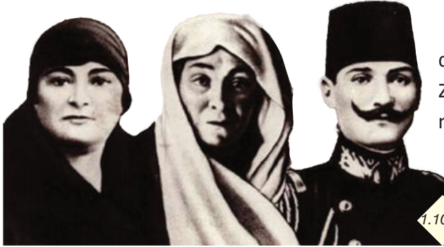
Soldan sağa: Mustafa Kemal'in kardeşi Makbule Hanım, annesi Zübeyde Hanım ve babası Ali Rıza Bey.

Ali Rıza Efendi, geniş görüşlü, modern, düşünceli, yeniliklere açık, aydın bir insandır. Zübeyde Hanım da fedakar, Ali Rıza Bey'e göre daha muhafazakardır. Mustafa Kemal'in kişiliğinin oluşumunda onu yetiştiren öğretmenlerinin de payı büyüktür. Öğretmenleri onu değişik yönlerde etkilemiş, yararlı yönlerde rehberlik etmişlerdir. Mustafa Kemal'in yetişmesinde aldığı eğitimin önemli bir etkisi ve katkısı vardır. Bu süreçte aile