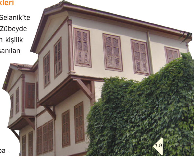
Selanik'te Mustafa Kemal'in doğduğu ev.

Mustafa Kemal Atatürk 1881 yılında Selanik'te doğmuştur. Babası Ali Rıza Efendi, annesi Zübeyde Hanım'dır. Her insanın yaradılışından gelen kişilik özelliği önce aileden sonra da içinde yaşanılan ortamın kültürel değerlerinden etkilenir. Mustafa Kemal Atatürk, kendi bilgi birikimini yaşadığı çevrenin etkisiyle birleştirerek bir düşünce yapısı oluşturmuştur. Mustafa Kemal'in düşünce yapısının oluşmasını aile çevresi ile çocukluğu ve idadi yılları ile gençliği şeklinde iki dönem hâlinde incelemek gerekir. Çocukluk döneminde onu etkileyen insanların başında babası ve annesi gelmektedir.