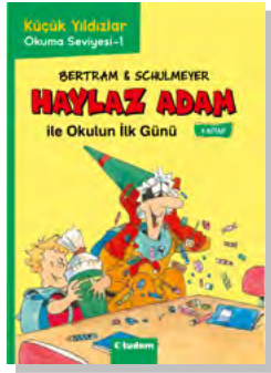
Okulun İlk Günü