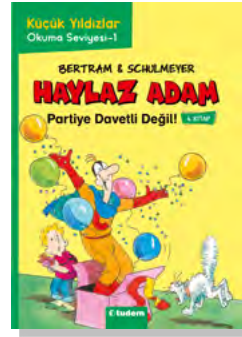
Partiyeye Davetli Değil